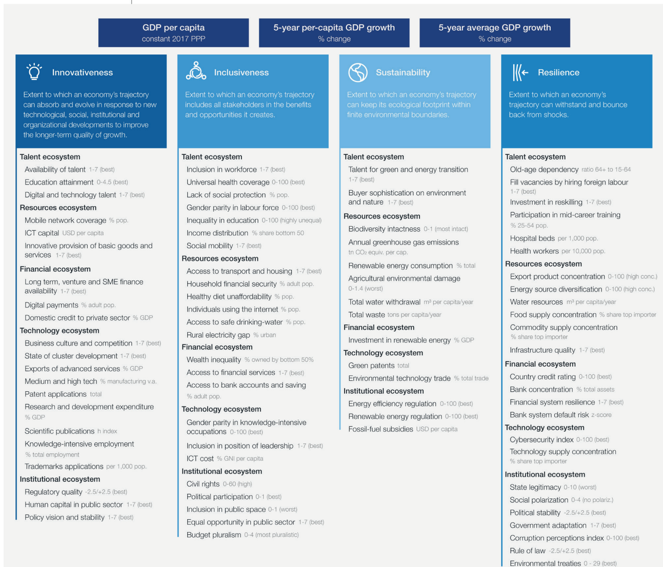
FIGURE 2 The Future of Growth Framework